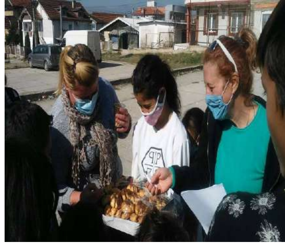
Родителски средби јануари 2020 година